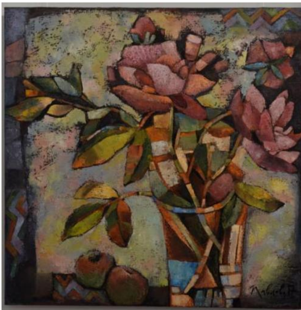
«Ранок на двох»

Студенти із захопленням розглядали живописні полотна мисткині, які є досить метафоричними та асоціативними.