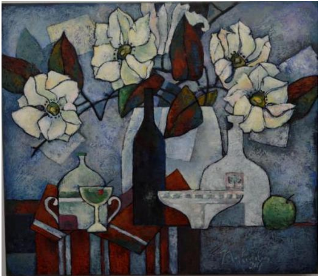
«Зеленый аромат. Абсент»