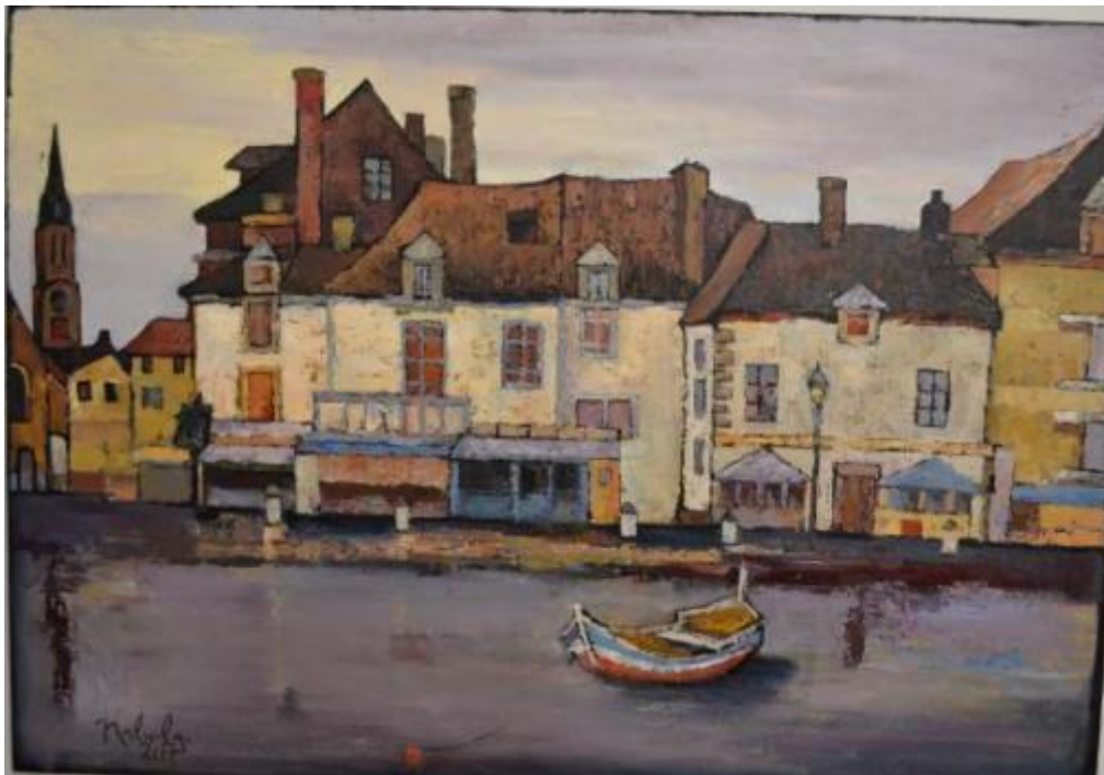
«В пошуках міста ілюзій»