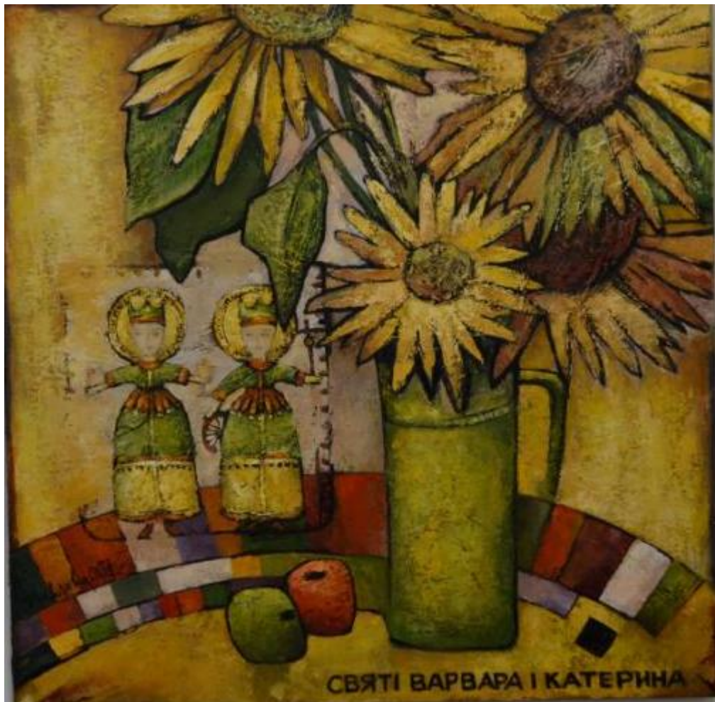
«Святі Варвара і Катерина»